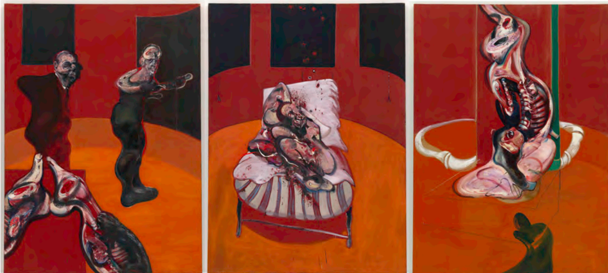
Fig. 5. Francis Bacon, Three Studies for a Crucifixion , 1962.