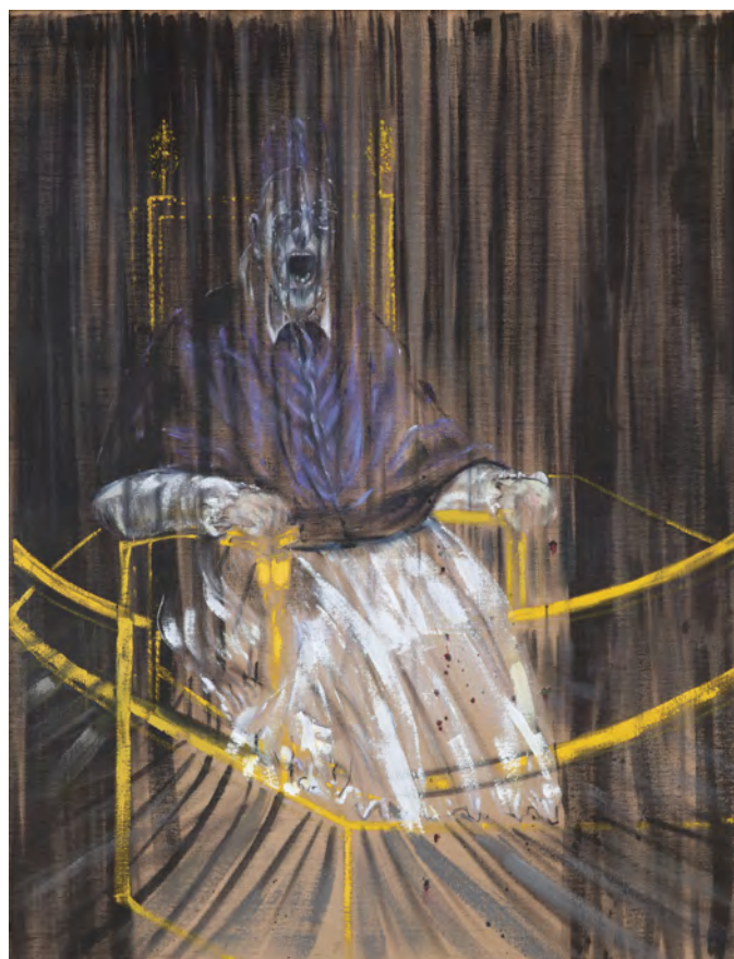
Fig. 6. Francis Bacon, Study After Velázquez's Portrait of Pope Innocent X , 1953.