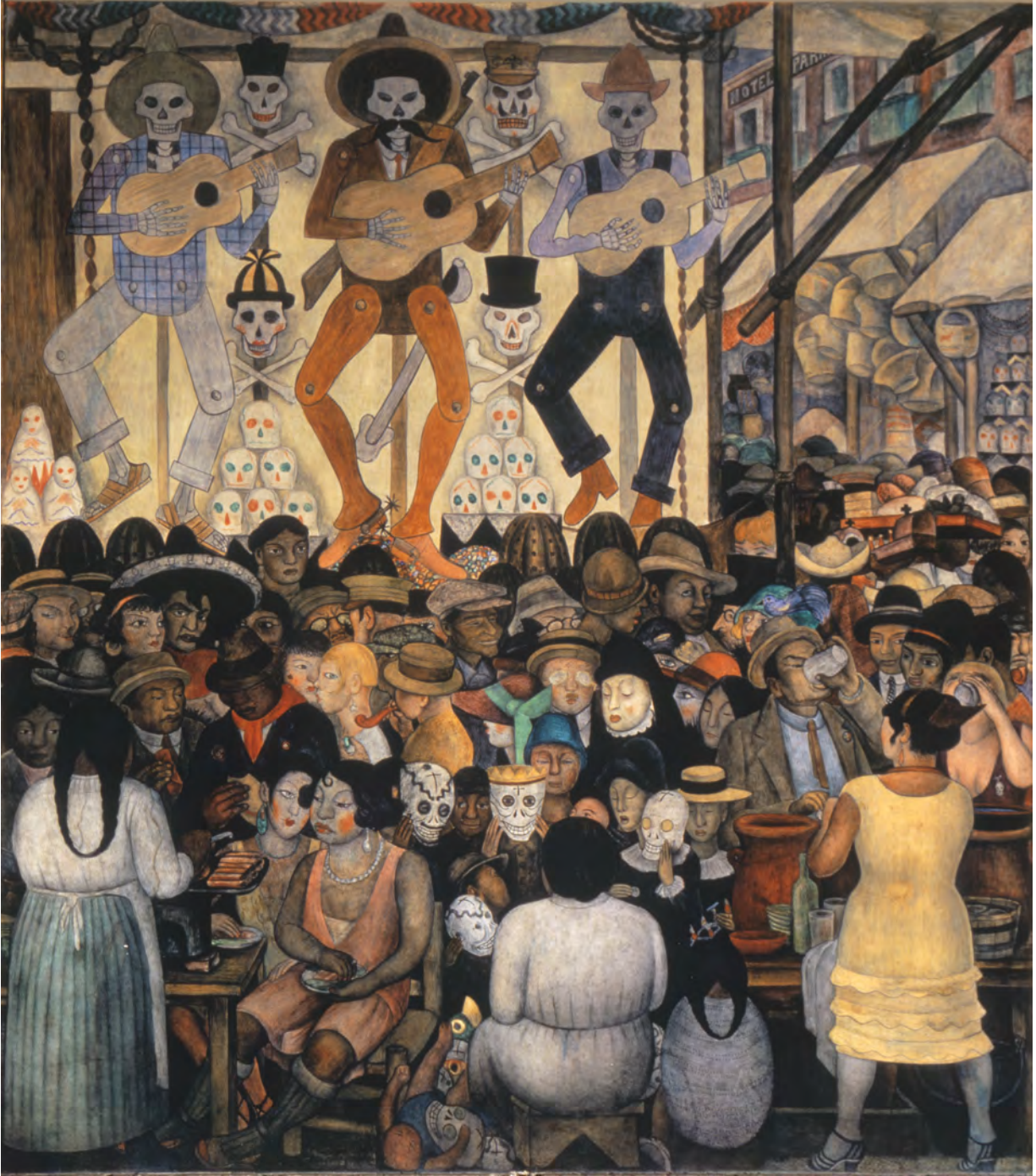
Fig. 4. Diego Rivera, Día de Muertos . Panel del Patio de las fiestas , en la planta baja de la SEP, 1924.