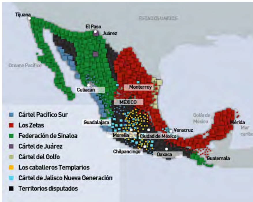
Fig. 2. “El nuevo mapa del narcotráfico en México”, Animal Político , 2012.